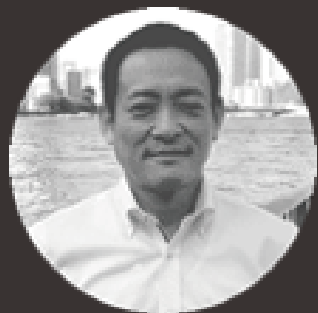
合同会社足立ギルド運送店 代表 (NPO 法人伝三郎商会 理事長)